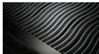
Grilles de cuisson WAVE™ emblématiques en acier inoxydable