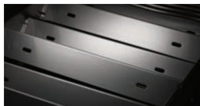
Diffuseurs à deux niveaux