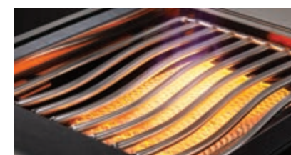
Brûleur latéral infrarouge SIZZLE ZONE™