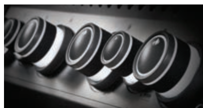
Boutons de commande rétroéclairés en blanc